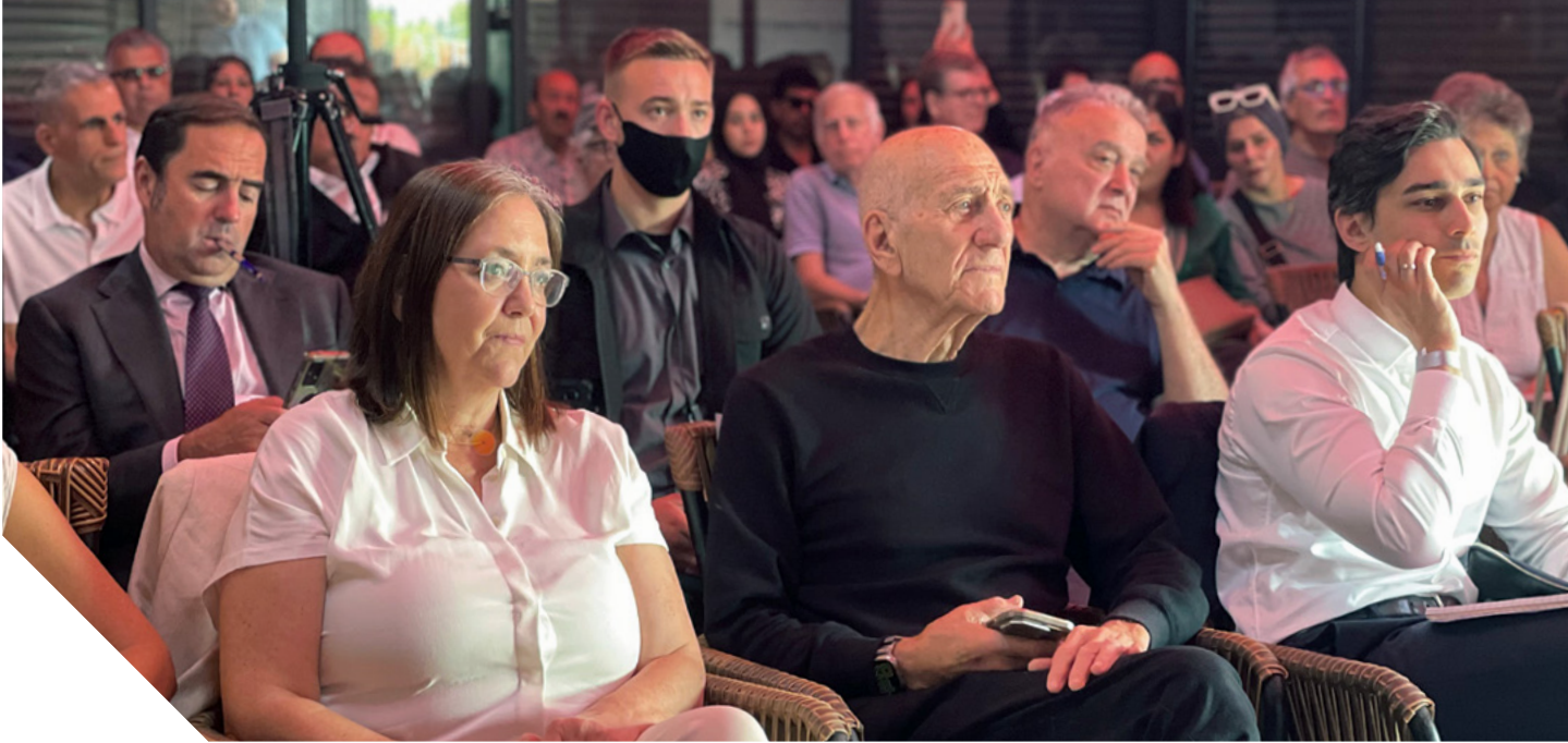
Ehud Olmert, ehemaliger Premierminister Israels und Kerstin Müller auf der Veranstaltung des Netzwerk Nahost am 10. November 2025 bei Jericho, palästinensische Gebiete